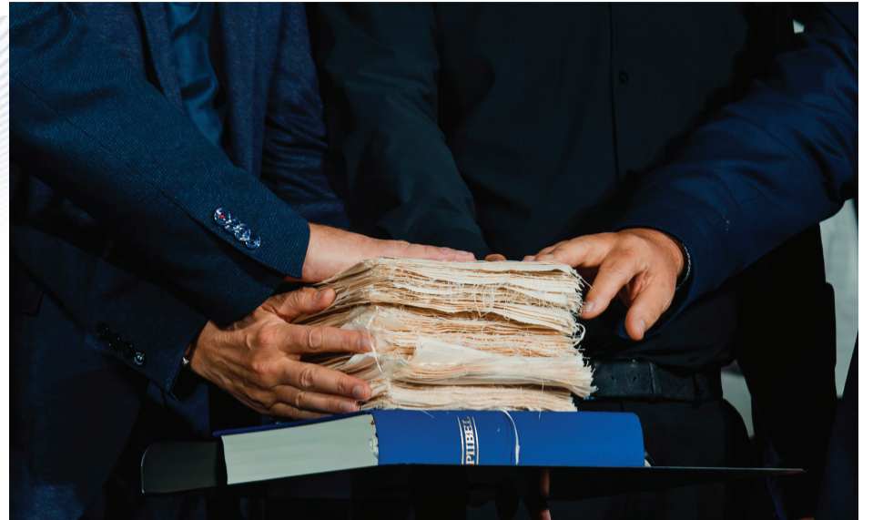
TTT teenistustel palvetatakse palverätikute eest, mida saab haigetele viia.