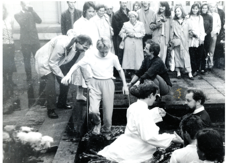
Ristimine purskkaevus endise EKP Keskkomitee hoone ees.

Ta vastas, et olen selleks liiga noor ja ei pruugi seda kõike veel mõista. Kuid ma mõtlesin – kui ma olen piisavalt vana, et uskuda jõuluvana, siis miks mitte Jeesusesse? Samal suvel läksin baptistikogu-