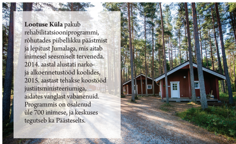
Lootuse Küla.

Lootuse Küla pakub rehabilitatsiooniprogrammi, rõhutades piibellikku päästmist ja lepitust Jumalaga, mis aitab inimesel seesmiselt terveneda. 2014. aastal alustati narko- ja alkoonetustööd koolides, 2015. aastast tehakse koostööd justiitsministeeriumiga, aidates vanglast vabanenuid. Programmis on osalenud üle 700 inimese, ja keskuses tegutseb ka Päästeselts.