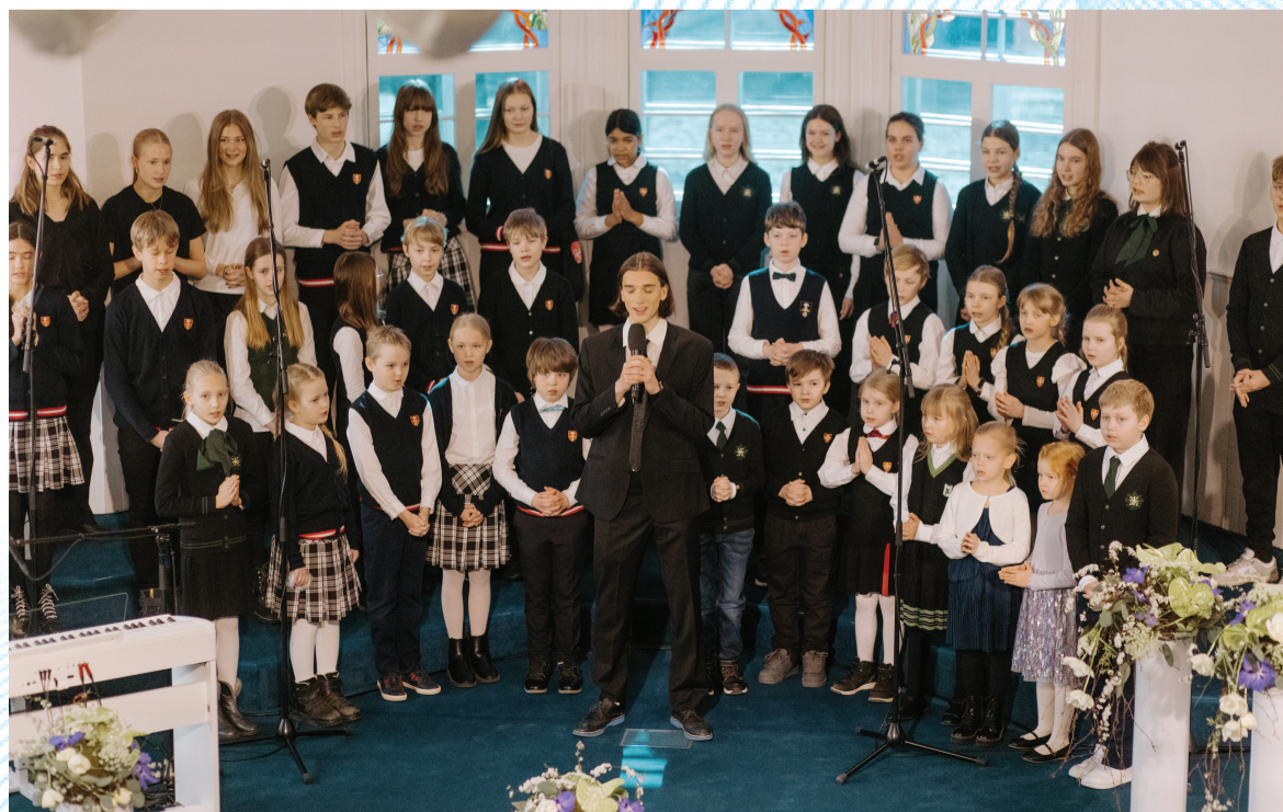
Esimene Meie Isa palve kooslugemine 2024. aastal.