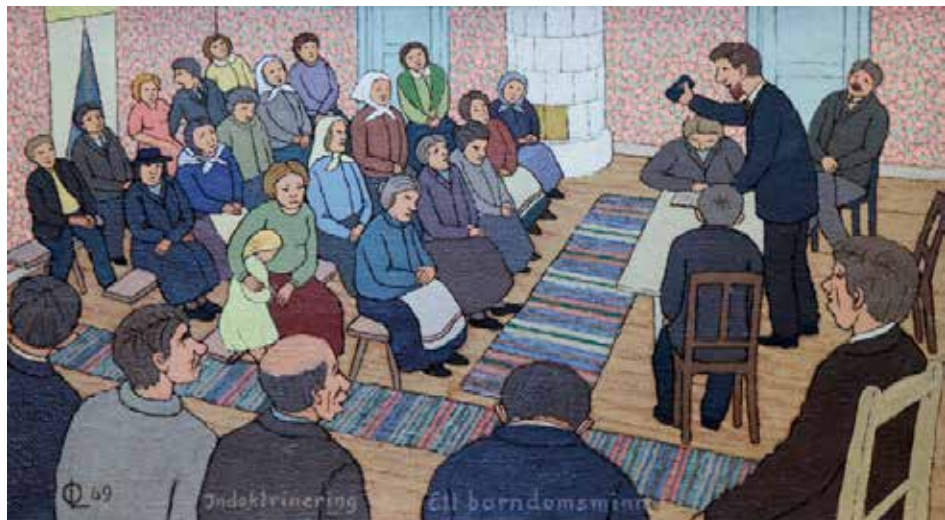
Riguldi mälestuste põhjal tehtud maal. Lapsepõlvemälestusi, palvetund.

Österblom suutis valdavalt kirjaoskamatute saareelanike lapsed kooli meelitada ja lükata käima kohaliku koolielu. Lisaks