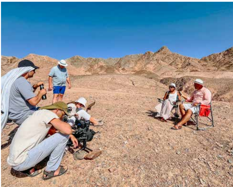
Saatesarja „Piiblimatkad kõrbes“ võtted.

Iisrael on maa, mida külastades poeb see mingil seletamatul viisil külastajate südamesse kogu eluks. See jääb meid siia tagasi kutsuma. Siit lahkudes ei lahku see sinu mõtetest, igatsustest, südamest. Märkamatu leiad end palvetamast Jeruusalemma, selle maa ja rahva hea käekäigu eest ja tunned valu ja rõõmu ühes nendega. See on nähtamatu, seletamatu side meie Jumala maaga ja prohvetlik tunnetus töötuste täitumise ootuses, mis on peatselt aset leidmas. ●